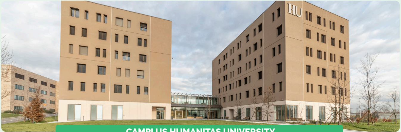
CAMPLUS HUMANITAS UNIVERSITY

La Fundación C.E.U.R. (Centro Europeo Università e Ricerca), colaborador del Camplus College , tiene como finalidad “la formación cultural de jóvenes universitarios en el ámbito de la Universidad y la investigación, en particular mediante la creación y la dirección de colegios mayores y residencias universitarias” (Art. 2 del Estatuto).