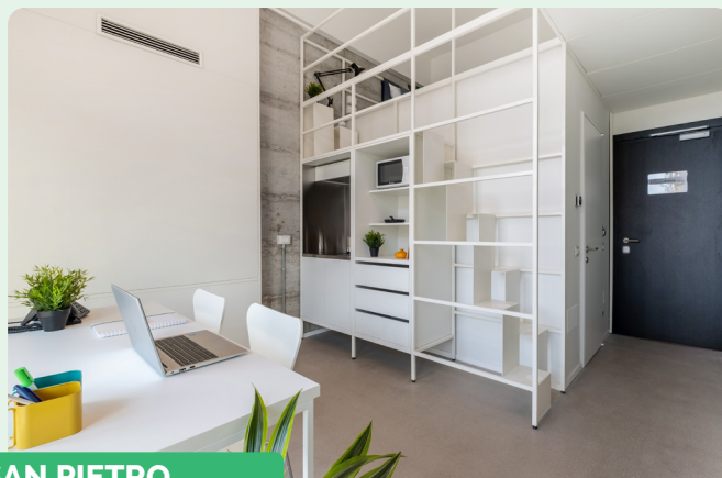
CAMPLUS SAN PIETRO

Via di Villa Alberici, 14 - 00165 - Roma (RM) Entrada peatonal: Via del Cottolengo, 30